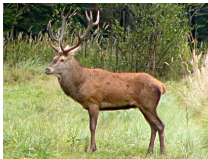
jelen divoké prase