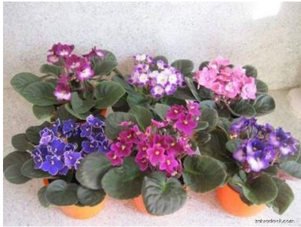
AFRICKÁ FIALKA KLÍVIE