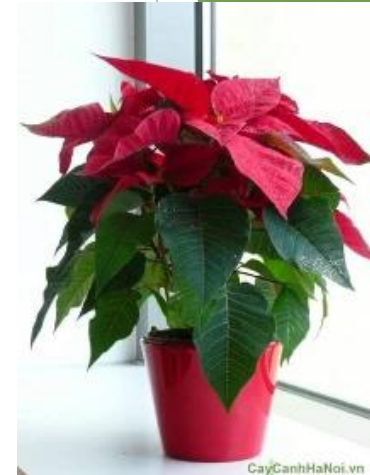
VÁNOČNÍ HVĚZDA VÁNOČNÍ KAKTUS