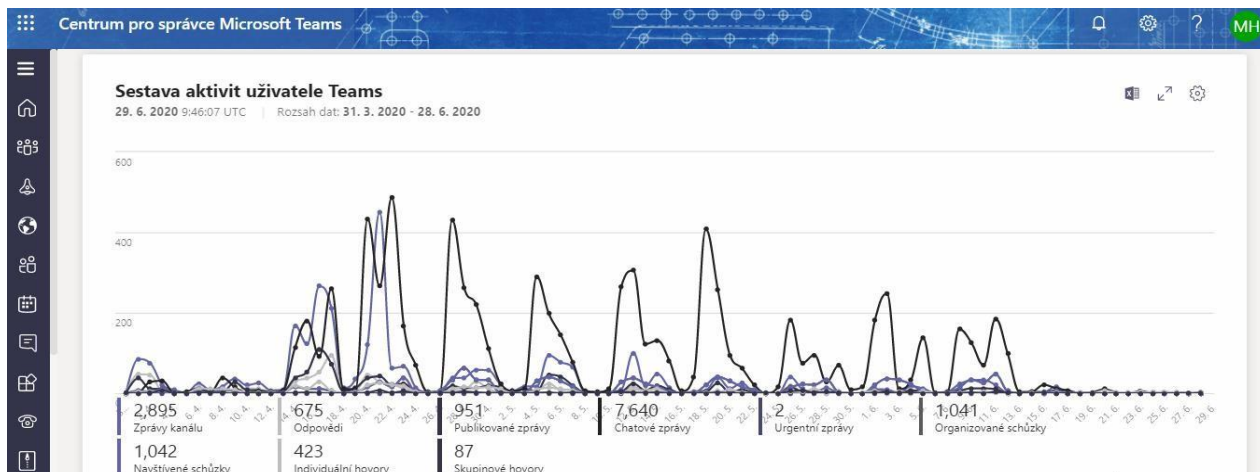
Obrázek 2: Od 1. dubna do 13. 6. proběhlo 1042 schůzek.