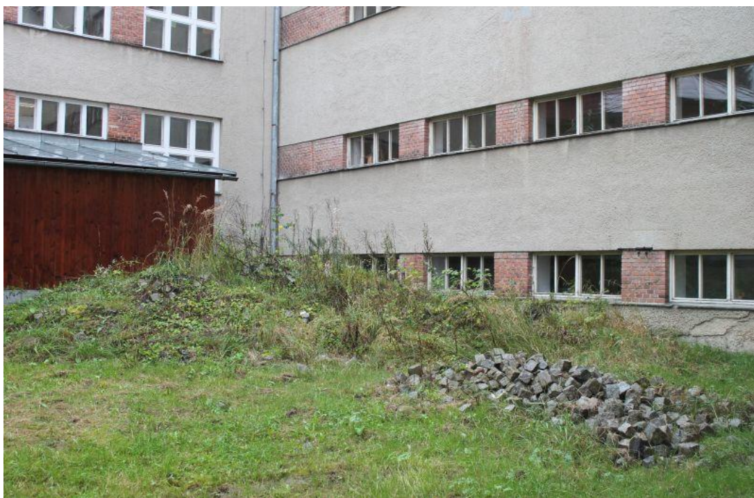
Příloha č. 1: